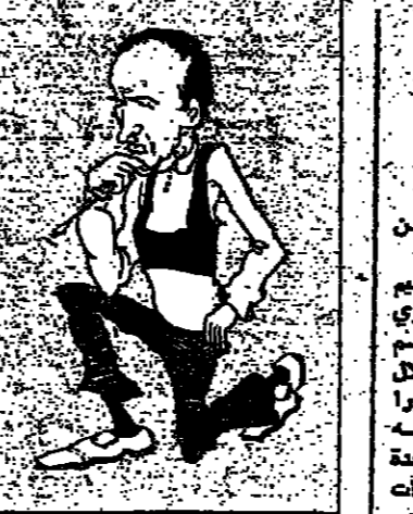
السفير الفرنسي في الصومال

وقالت مصادر عسكرية في سيامبون، وهي من اللجان الشعبية القريبة من الحدود الكمبودية، ان قوات الجيش الشعبي الثوري والفيتنامية الجنوبية تسيطر على العاصمة كمبوديا منذ وقت طويل. وقالت مصادر فيتنامية ان قوات فيتنام الجنوبية تسيطر على العاصمة كمبوديا منذ وقت طويل. وقال مصدر عسكري في سيامبون، ان قوات فيتنام الجنوبية تسيطر على العاصمة كمبوديا منذ وقت طويل. وقال مصدر عسكري في سيامبون، ان قوات فيتنام الجنوبية تسيطر على العاصمة كمبوديا منذ وقت طويل.